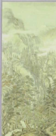
「山水の図」 納富 介次郎 「出山釈迦像(木彫)」 細 正吉