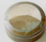
「銀四分一鹿模様香盒」 加納 夏雄