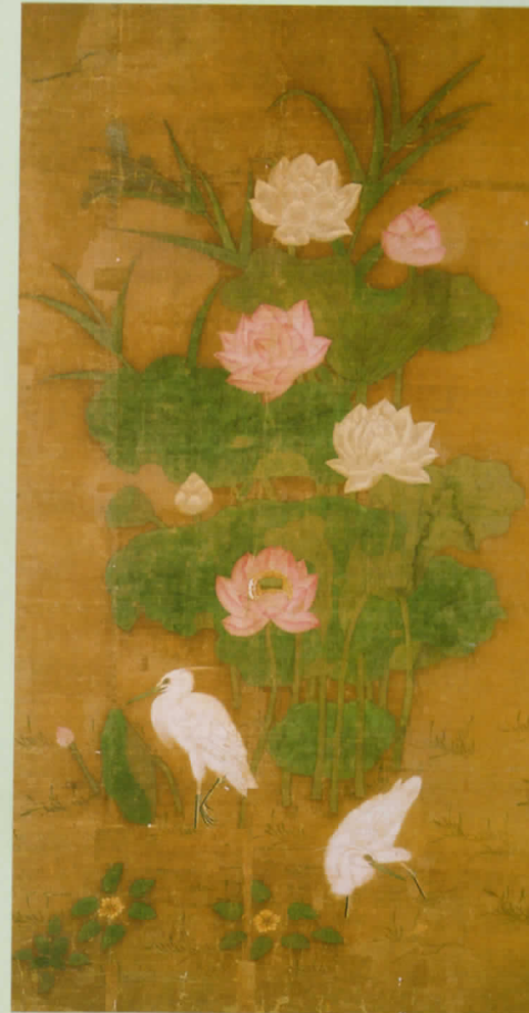
「蓮花驚図」 依呂紀作